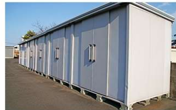
物置・エクステリア商品